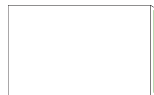
Badana Envelope 4 x 21 cm (mancha com moldura de 5mm)