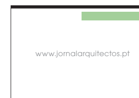
Banner 728 x 90 px